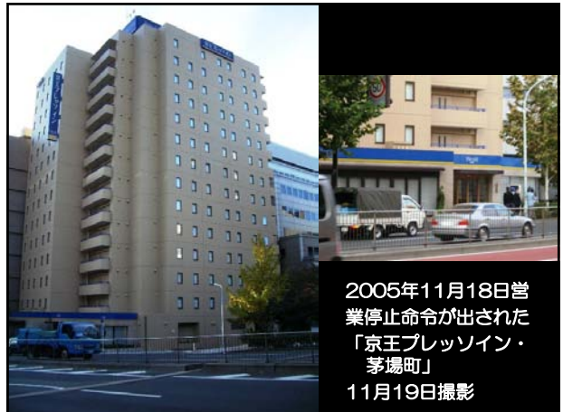
2005年11月18日営業停止命令が出された「京王プレッソイン・茅場町」 11月19日撮影